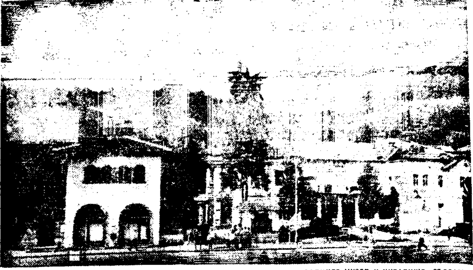
ТЕТЕВЕН — НАРОДНИЯТ МУЗЕЙ И ЧИТАЛИЩЕ „СЪГЛАСИЕ“